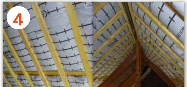
4 UN RÉSULTAT EFFICACE, PROPRE ET DÉFINITIF.