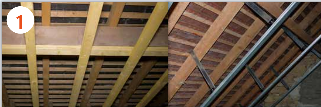
1 PRÉPARATION DU CONTRE CHEVRONNAGE OU RAILAGE À PLAQUES DE PLÂTRE