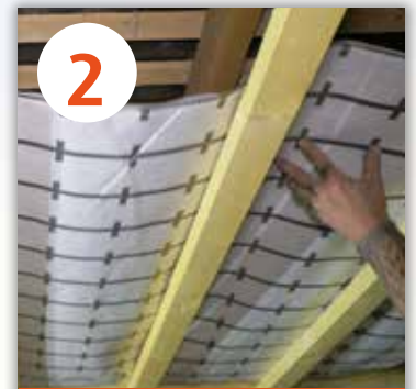
2 MISE EN PLACE DES ISOSAC®