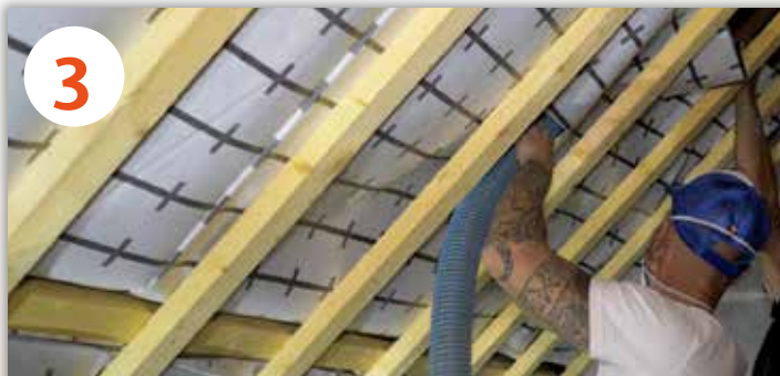
3 SOUFFLAGE DE L'ISOLANT EN VRAC À HAUTE DENSITÉ